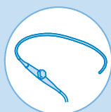
Transösophageale Ultraschallsonden (TEE)